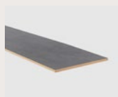
Dark Grey Stone